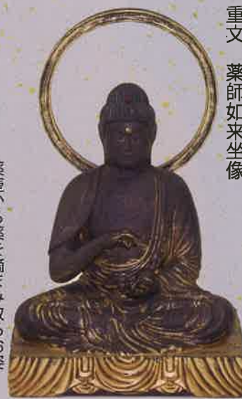
第42番 勝持寺(京都) 重文 薬師如来坐像