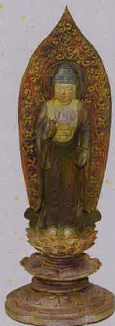
第8番 室生寺(奈良) 重文 薬師如来立像

西国四十九薬師霊場会・開創三十周年記念として、三体のお薬師様のお像（写身）をお作りいたしました。（寺院公認、数量限定、シリアルNo.付）