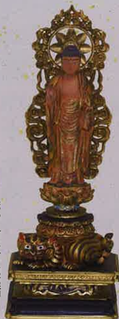
第32番 西明寺(滋賀) 秘仏 薬師如来立像(虎薬師)